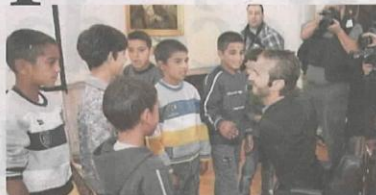
Sa decom iz Doma za nezbrinutu decu iz Bele Crkve

Situacija je bila ista i na platu ispred fakulteta, gde je bio